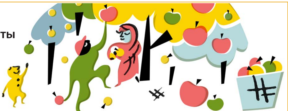
Фото: Графика: Минна Аланко, «Съедобные парки», Minna Alanko, банк графических материалов города Хельсинки

В октябре все жители столицы смогут проявить креативность. Всевозможные идеи приветствуются, и вместе с горожанами в течение весны будут разработаны предложения, которые представят на весеннее голосование.