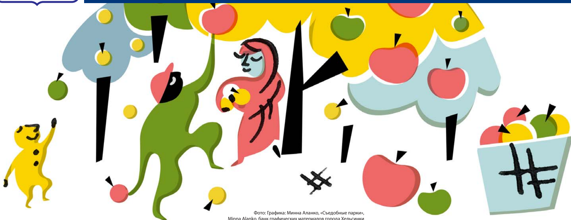
Фото: Графика: Минна Аланко, «Съедобные парки», Minna Alanko, банк графических материалов города Хельсинки